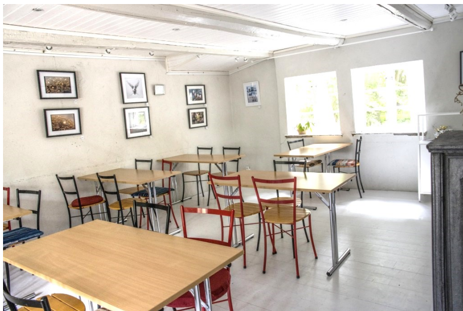
Utställnings- och mötesrummet