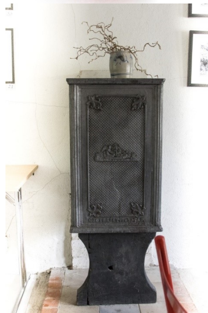
Sättugnen från 1799.